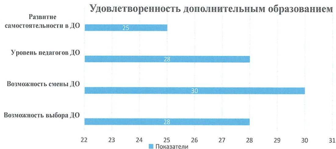
Диаграмма 1. Удовлетворенность дополнительным образованием. Отпрошено 31 респондентов (родителей, обучающихся 1-10 классов).

В системе дополнительного образования школа активно использует партнёрство с вузами, центрами искусства, научными и творческими центрами, спортивными учреждениями.